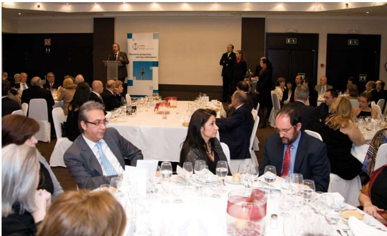
Cerca de 300 invitados acudieron a la Cena de Navidad que todos los años celebra el Colegio.